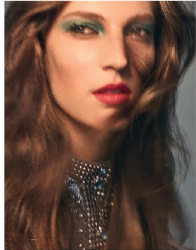
DISCO-LOOK Diese Seite: Krieglänges Meshkleid mit Metallplättchenbesatz, um 5900 €, von PACO RABANNE . Lidschatten „Single Eyeshadow Zambezi“ und Lippenstift „Bad Reputation“ von NARS . GLAM-DRESSES Linke Seite: Silberfarbenes Paillettenkleid mit von Hand aufgestickten Kristallen, von BLUMARINE .