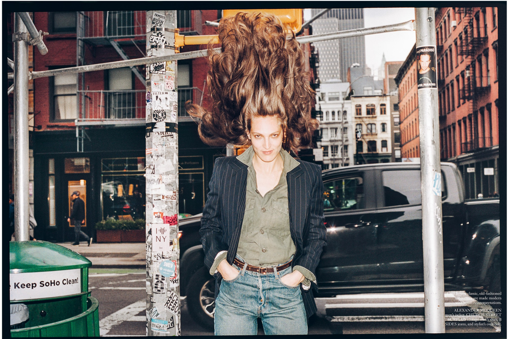
Careless classic, old-fashioned silhouettes are made modern with smart reinterpretations. ALEXANDER MCQUEEN men's jacket, CHURCH STREET - ST. RPLUS Chicago men's shirt, B SIDES jeans, and stylist's own belt.