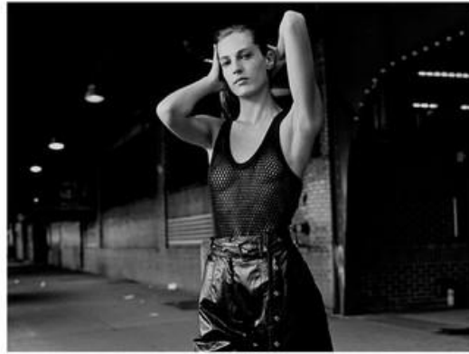
Look up by P. Rubin Shoes by Christian Louboutin