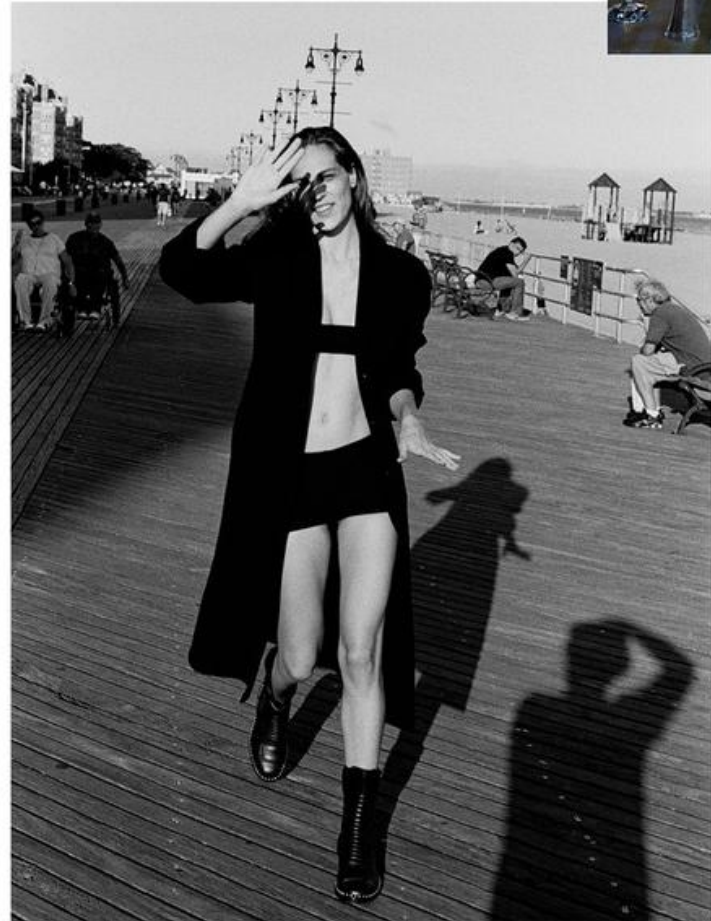
Shoes by Christian Louboutin