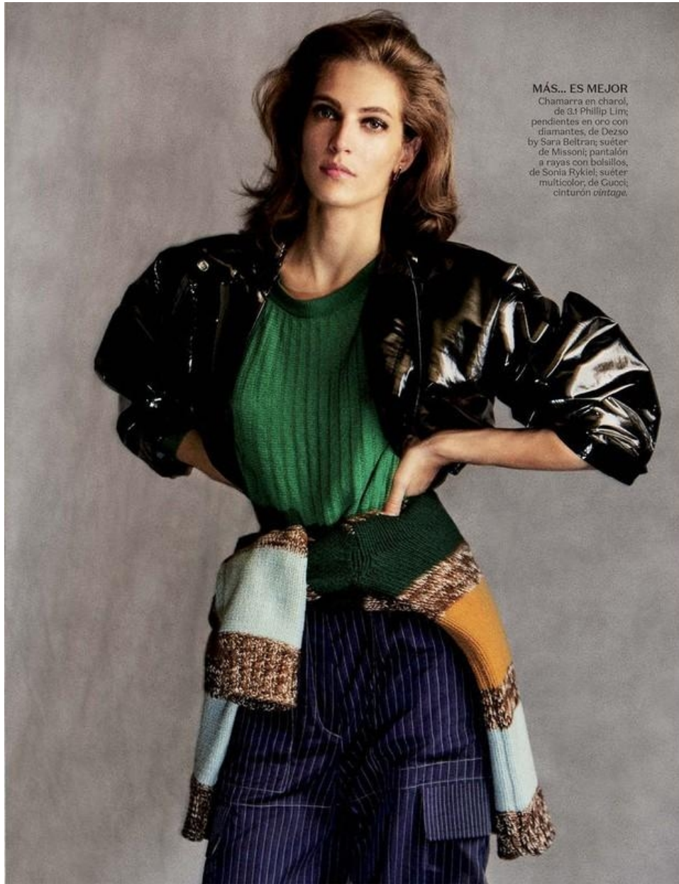
MÁS... ES MEJOR Chamarra en charol, de 3.1 Phillip Lim; pendientes en oro con diamantes, de Dezo by Sara Beltran; suéter de Missoni; pantalón a rayas con bolsillos, de Sonia Rykiel; suéter multicolor, de Gucci; cinturón vintage.