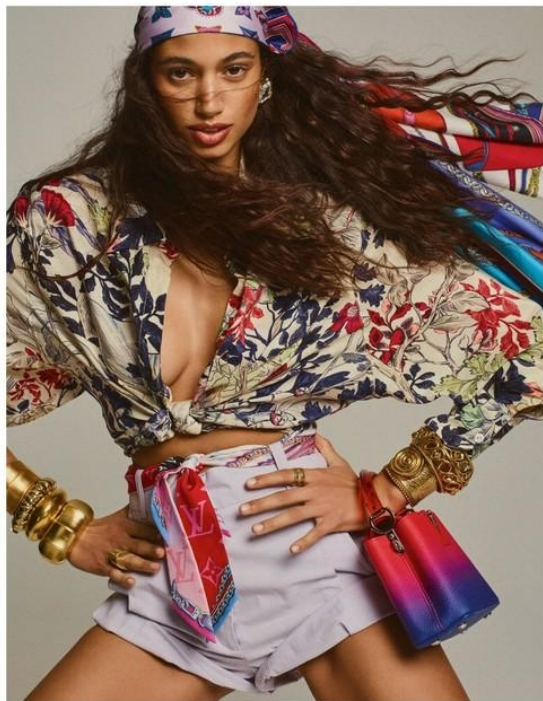
Blouse en soie légère imprimée, Chloé, 590 €. Short en coton, Balmain, 165 €. Sur-la-tête, sacre double face «L'été/été» en soie, 495 €. paré en crêpe, bandeau «Ultimate Monogram BB» en soie, 165 €, et ses mini «Capucines» en cuir, 390 €. Louis Vuitton. Bande d'épaule et à droite, bracelets, Valois Vintage. À gauche, bracelets, Giro, Bagno, Gentle Storm. Maquillage L'Oréal Paris avec le fond de teint infatigable 24H Matte Cover Camomille, la poudre bronzante Back to Bronze Fumé, l'ombra à paupières Color Queen Commandeur, le mascara Lash Paradise Noir, le rouge à lèvres infatigable 24H Duvetissime Sable et, sur les ongles, le vernis Essie Chantique Berceur The Stars. Cheveux mis en forme avec la crème sculptante de boucles Stylista 8Narc/Carlo de L'Oréal Paris.